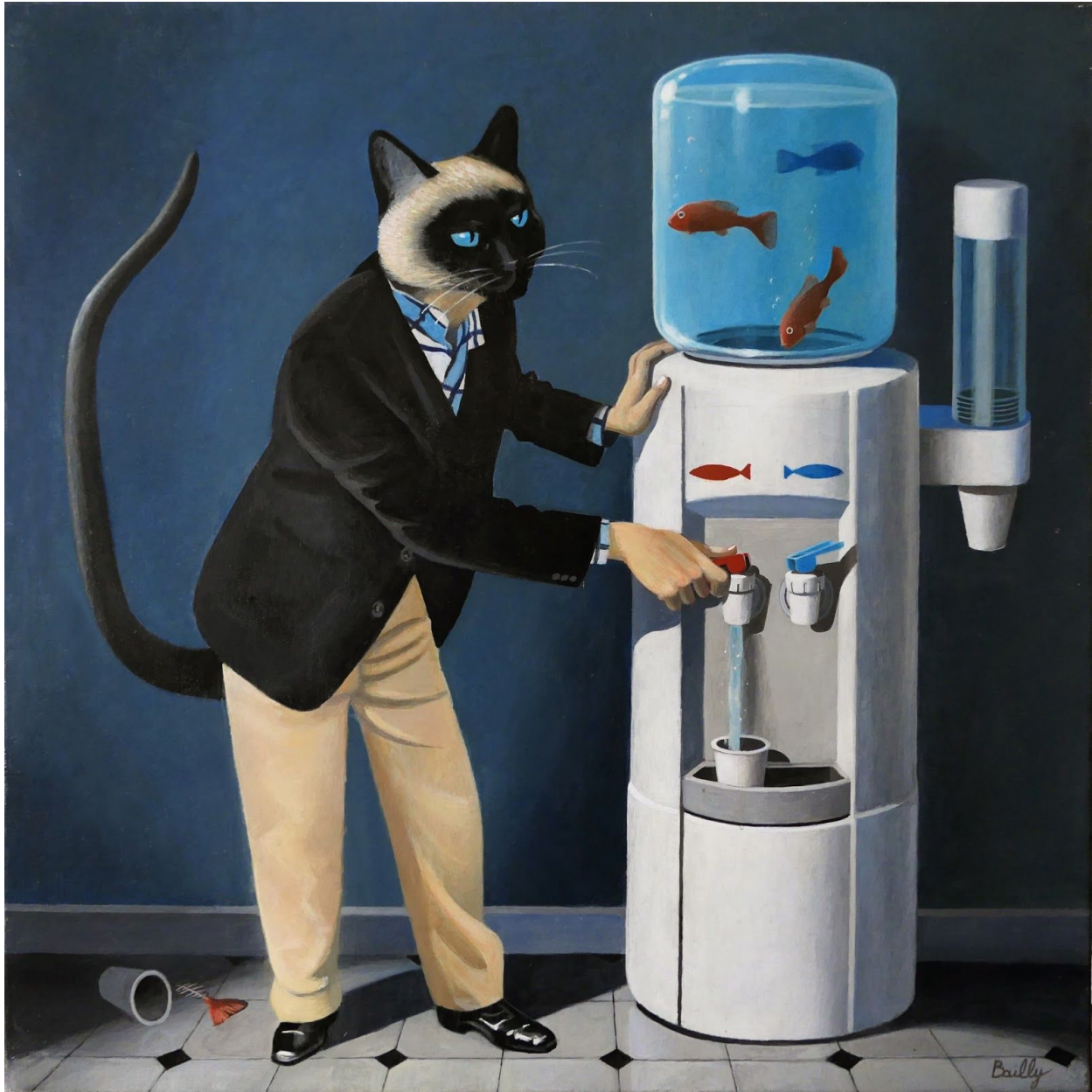
11. La Fontaine 2008 Acrylique sur toile 60 x 60 cm 2500 €