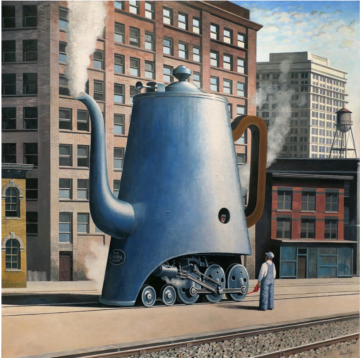
06. Café Central System 2018 Acrylique sur toile 90 x 90 cm 4500 €