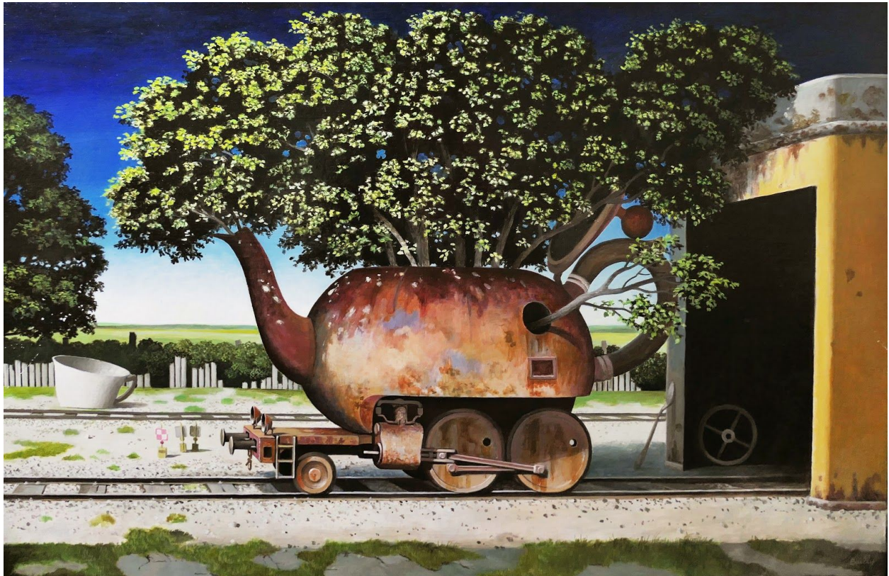
05. La Théière Abandonnée 2019 Acrylique sur toile 60 x 92 cm 3500 €