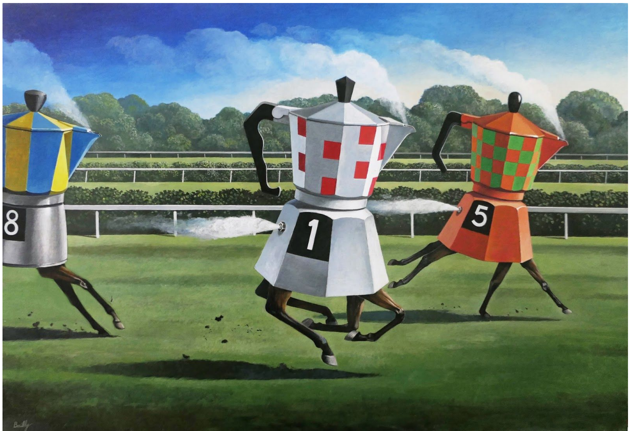
08. La Course des Chevaux-Vapeur 2014 Acrylique sur toile 89 x 130 cm 6000 €