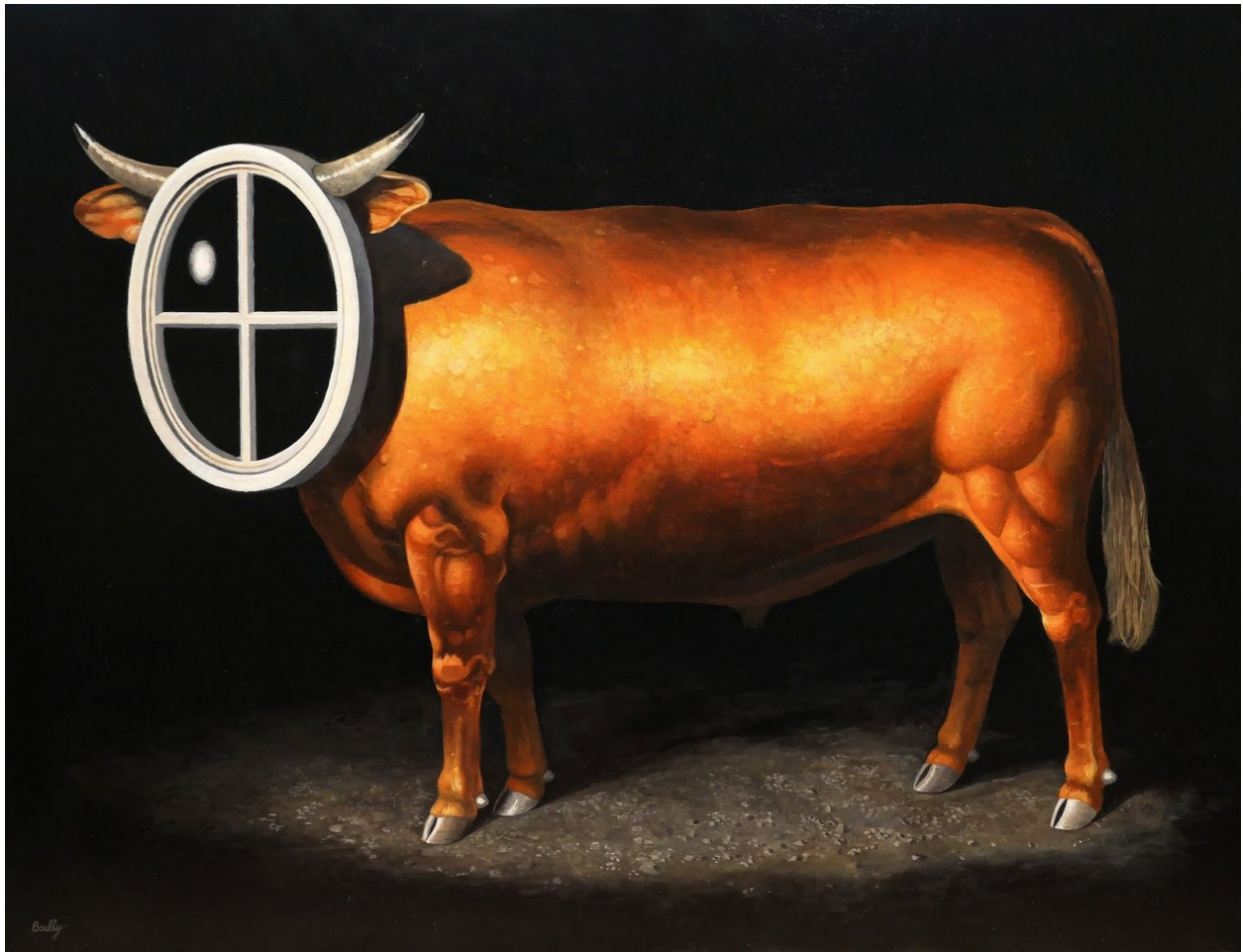
04. L'Oeil de Boeuf 2021 Acrylique sur toile 89 x 116 cm 5000 €