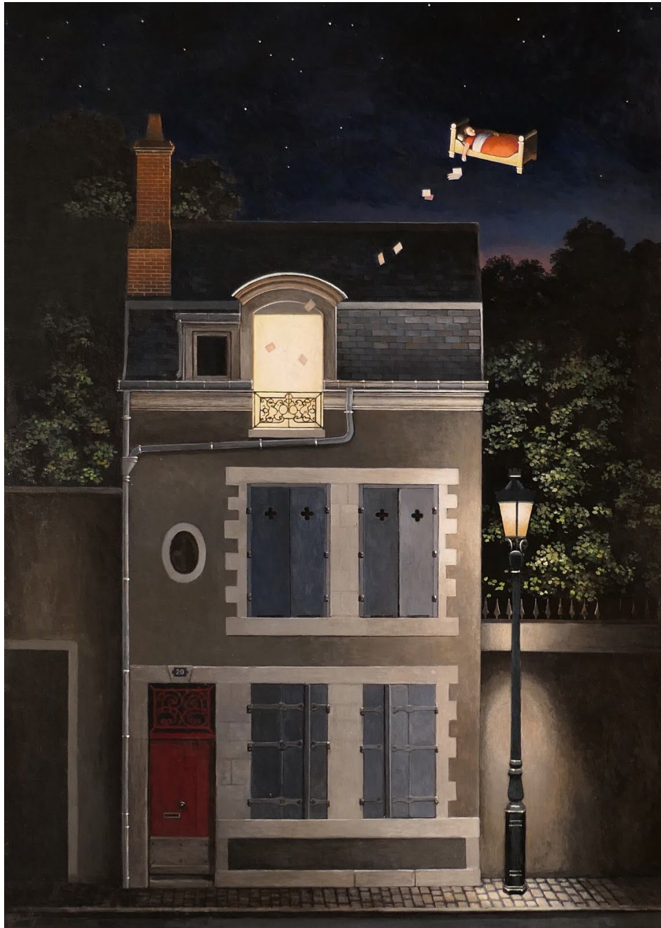
02. Le Songe 2020 Acrylique sur toile 116 x 81 cm 5000 €