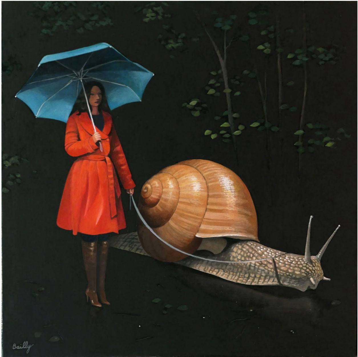
10. La Promenade de l'Escargot 2018 Acrylique sur toile 60 x 60 cm 2500 €