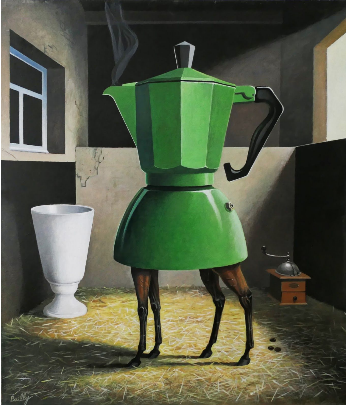
07. Le Box 2014 Acrylique sur toile 70 x 60 cm 3000 €