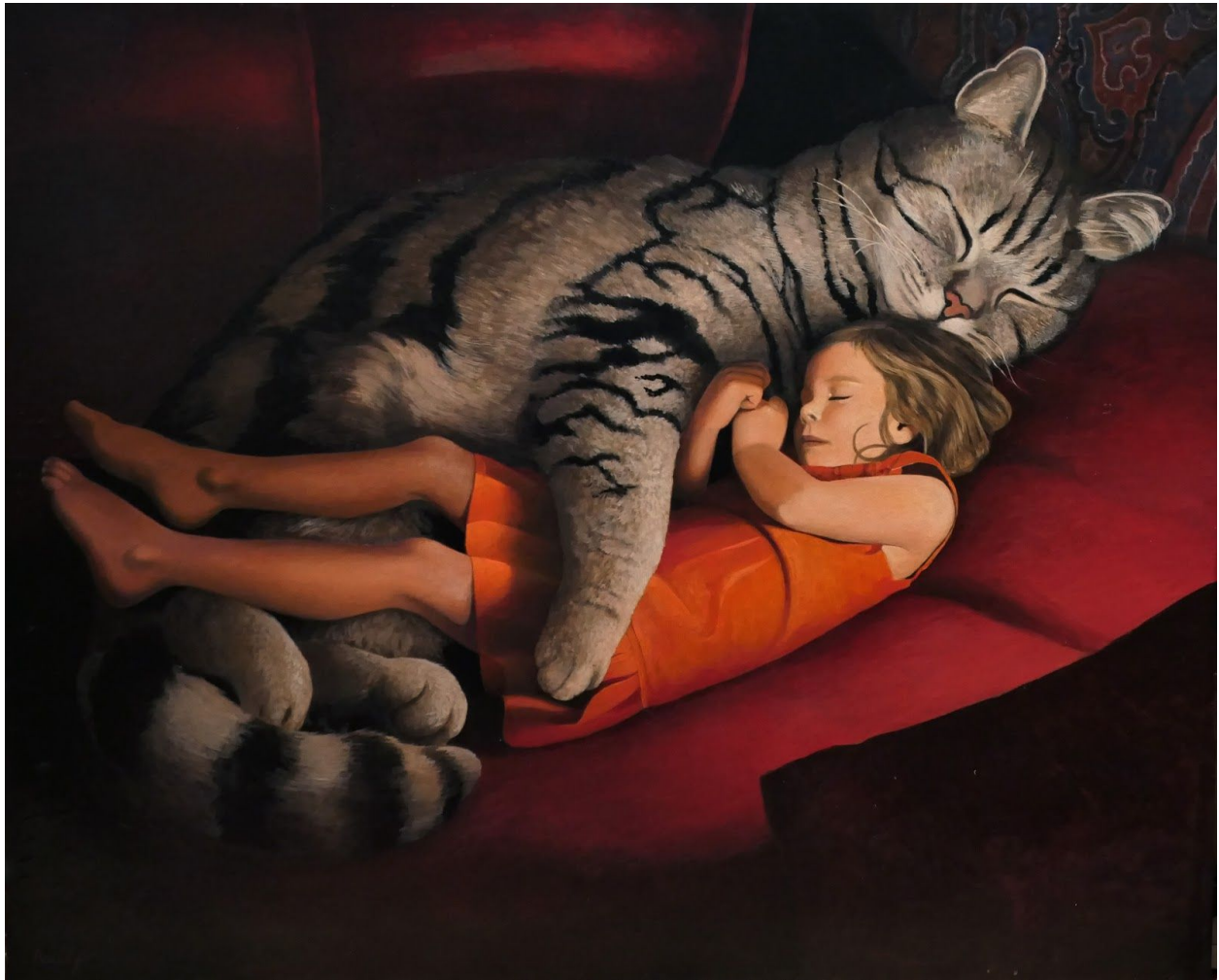
01. La Sieste 2021 Acrylique sur toile 81 x 100 cm 4500 €