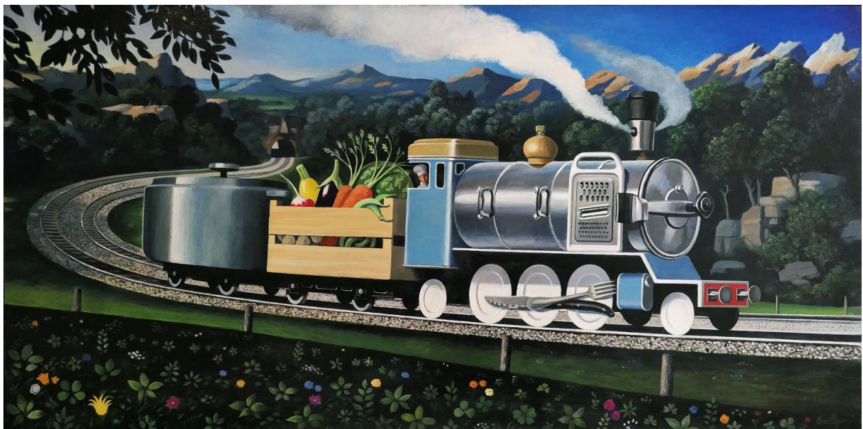
09. Le Train Potager 2012 Acrylique sur toile 50 x 100 cm 3500 €