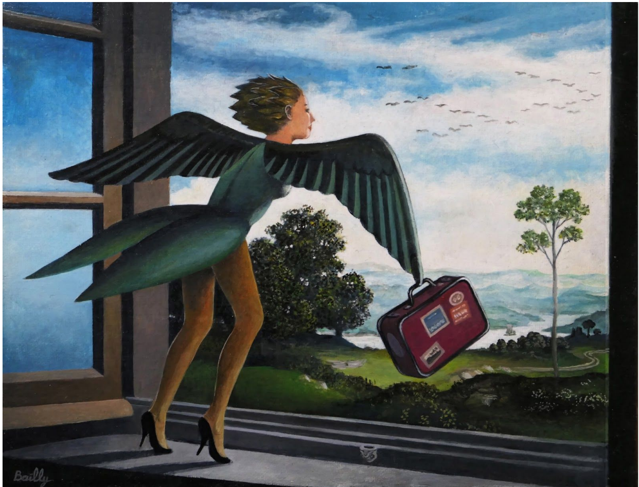
12. L'Envol 2015 Acrylique sur toile 27 x 35 cm 1000 €